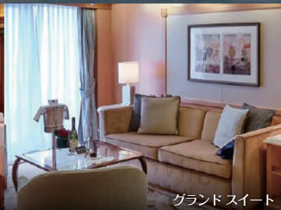
グランドスイート