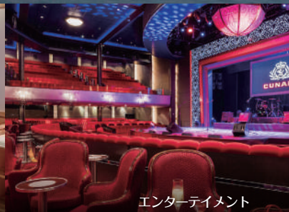
エンターテイメント