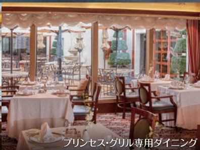
プリンセス・グリル専用ダイニング