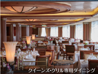
クイーンズ・グリル専用ダイニング

2026年は、日本発着コースの予定がございません。 2025年憧れの『クイーン・エリザベス』日本発着クルーズの貴重な機会をお楽しみください。