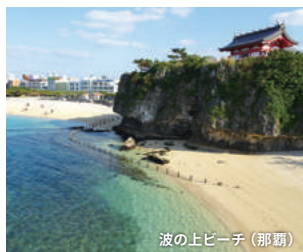
波の上ビーチ(那覇)